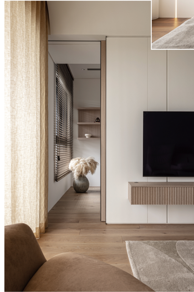
左頁·右頁：全室以塗料及木作為基底，讓全室色彩更加整體