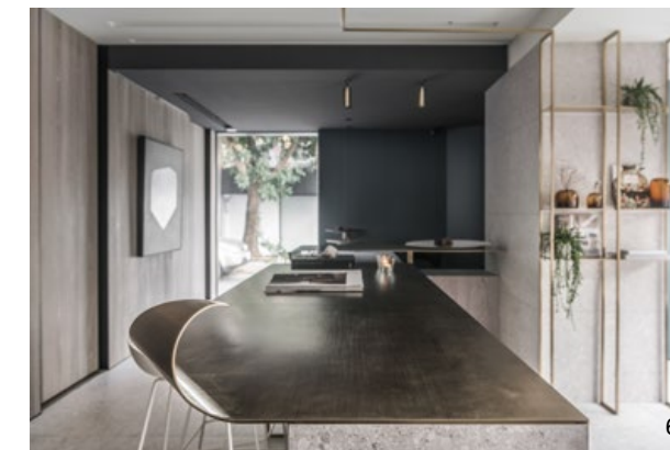
3. 降低入口存在感，將視覺集中櫥窗。4. 以水磨石搭配木皮，整體氛圍清爽舒適。5. 內部以量體取代實牆，呈現開闊視覺。6. 翹起的桌角使吧檯更加輕盈，且不阻擋轉角動線。7. 以中島吧檯取代傳統候診區的座椅。

業主期待此作能跳出一般醫療院所給予人的印象，除了將診療間置放於櫥窗內，更翻轉候診區設計以沙發為主的印象，於空間中央置入中島吧檯，設計師認為，過往候診區沙發的設計，使患者與患者間各自獨立而不相關，透過本作中島吧檯的動線設計，使其能夠呈現出不一樣的社交景象，為冰冷的醫療空間帶入人情的溫度，同時亦保留業主未來增設大型藝術品的可能性，使人們候診時不再拘束於沙發上，而是能四處遊走欣賞。吧檯以薄金屬板搭配水磨石牆，視覺上輕盈而不厚重，微微向上翹起的桌角帶入趣味性，更使轉角動線順暢，避免行走時碰撞。