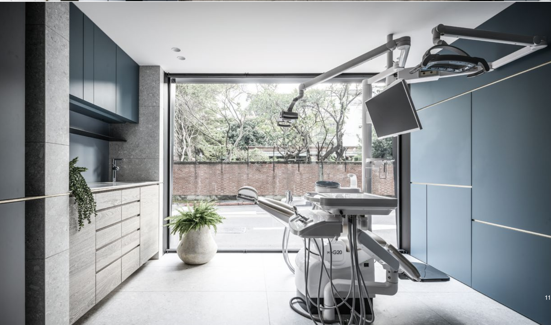
8. 點綴莫蘭迪色系面板，使空間具記憶點。9. 將矯正的器材與行為轉化為符號使用於金屬細件扶手上。10. 收納機能隱藏於量體之中。11. 窗面玻璃使用 LED 透明屏，需要時可開啓遮蔽。12. 診間內設有座椅提供病患陪同者使用。13. 平面圖。