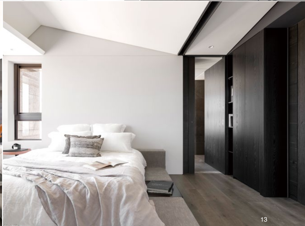
9. 整體空間佈局以平衡延伸為重點。10. 特殊傾斜天花使臥房視覺更加強烈。11. 斜天花的設計弱化原始建築中樑位與空調管線的存在感。12. 大面積的深色櫃體使臥房更為沉穩。13. 仿傾斜屋頂的角度使臥房更具有居住感受。