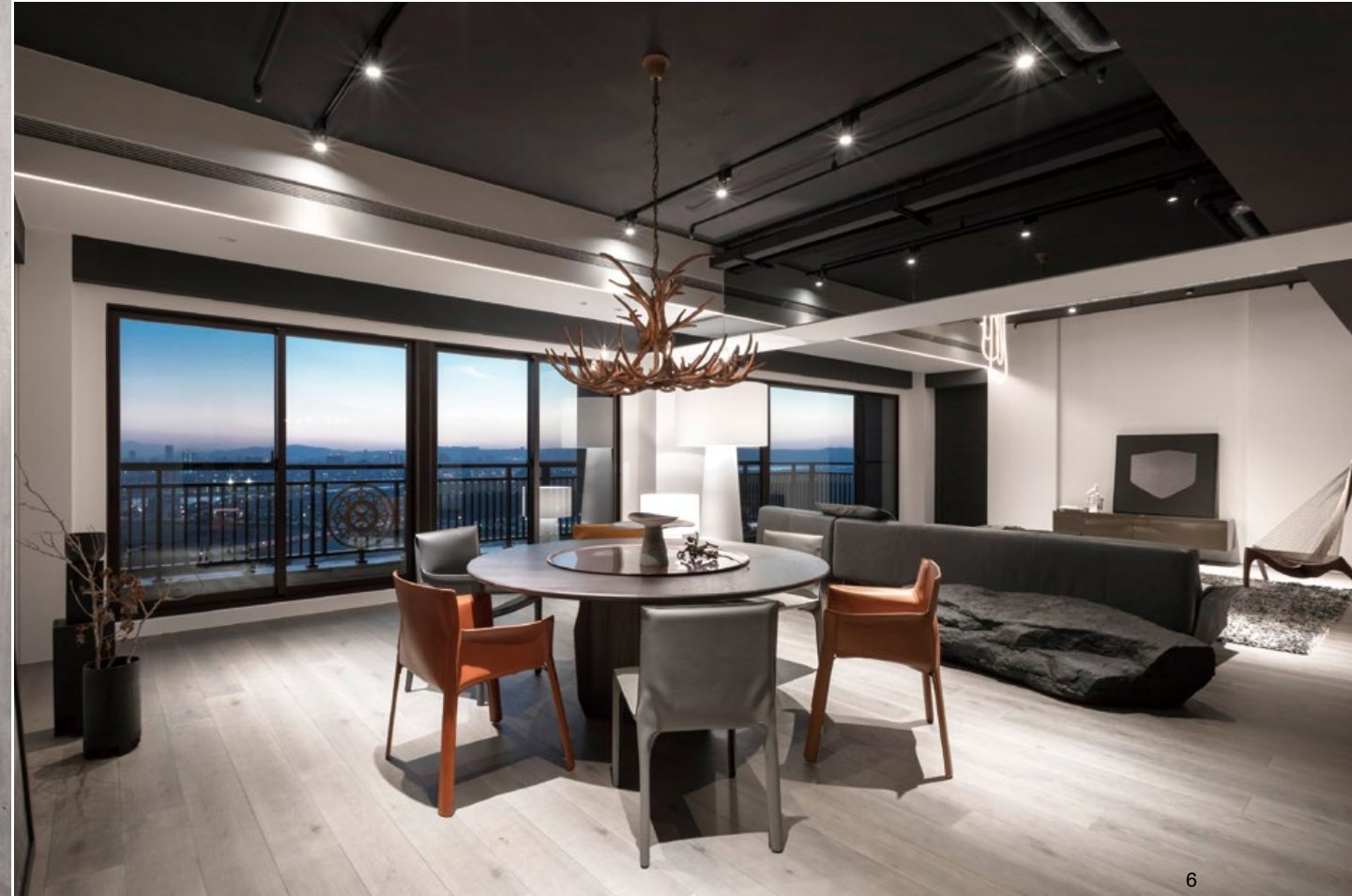
3. 以金屬網材質弱化牆體存在感，並豐富空間層次。4. 鐵件上增加板面，使其兼顧裝飾與機能性。5. 空間以光影作為主角，藉由軟裝的搭配增加變化。6. 中央主樑以灰鏡減低其存在感，產生虛實變幻。7. 平面圖。8. 纏繞於管線上的 LED 燈條象徵蟒蛇。